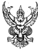
ขนาดตัวครุฑสูง ๓ เซนติเมตร